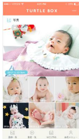
写真メニュー画面イメージ