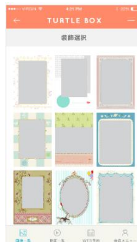
装飾選択画面イメージ