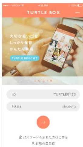
ログイン画面イメージ